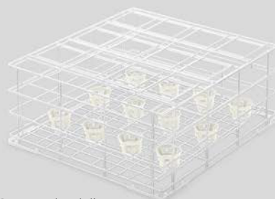
Cesto per bottiglie