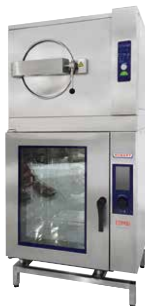
Esempio modello HT3101E

COMBI garantisce una cottura uniforme e precisa a bassa temperatura e una rosolatura regolare.