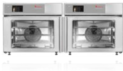
EB 30 MT

ELETTRICO Art.-Nr. EL3013001-2A Pannello argento