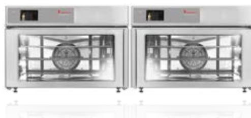
EB 30 XL MT

ELETTRICO Art.-Nr. EL3613001-2A Pannello argento